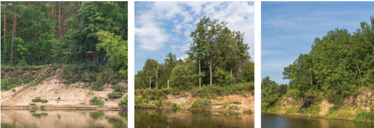
Рис. 3. Оползневые склоны в долине реки Клязьмы Fig. 3. Landslide slopes in the Klyazma River valley

выветривания, водной эрозии, абразии и суффозии; гидрогеологическими — процессы протаивания и промерзания грунтов, слагающих склоновые массивы; техногенными — нагрузки при строительстве зданий и сооружений.