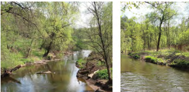
Рис. 4. Оползневые склоны в долине реки Десны Fig. 4. Landslide slopes in the valley of the Desna River

У деревни Быковка выявлен глубокий оползень выдавливания длиной около 3,7—3,9 км, связанный с деформацией верхнеюрских глин оксфордского яруса.