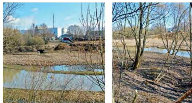
Рис. 1. Оползневые склоны в долине реки Сетунь Fig. 1. Landslide slopes in the valley of the Setun River

Высота склонов, подверженных развитию и активизации оползневых процессов, варьируется в диапазоне от 2—5 до 45—50 м. Наиболее распространенная высота склонов превышает 10 м, что составляет около 74% от общего числа, 17% склоновых участков характеризуются высотой более 30 м, тогда как 9% склонов имеют высоту менее 10 м.